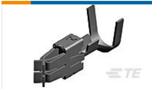
TE 产品编号968037-2 SPT A REC 6.3 Contact SWS Sn