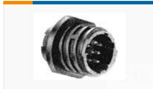
TE 产品编号206838-4 CPC RECPT SEALED SIZE 23-24