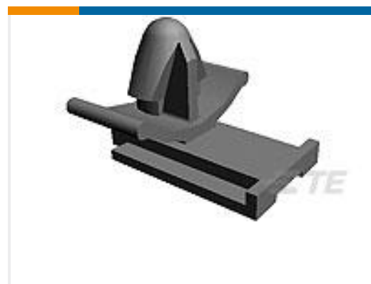
TE 产品编号85229-1 CLIP HSG FOR 070 (EJ MK-II)