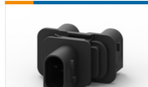
TE 产品编号2278730-1 3P CAN CONNECTOR, RECEPTACLE ASSY