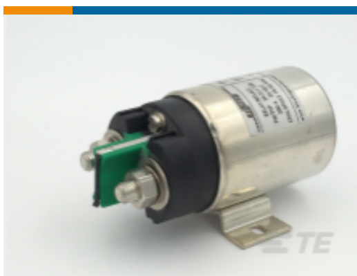
TE 产品编号K1010834 Relay 29-211-11