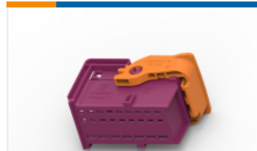
TE 产品编号1-2141847-2 CARRIER, RECEPTACLE HSG, 36 POS, ASSY