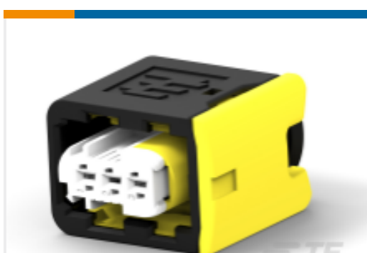
TE 产品编号2306960-1 3 POS, AMP MCP 1.5K, REC HSG ASSY, SLD, COD A