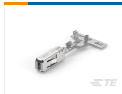
TE 产品编号1-2141859-1 AMP MCP 2.8, CONTACT