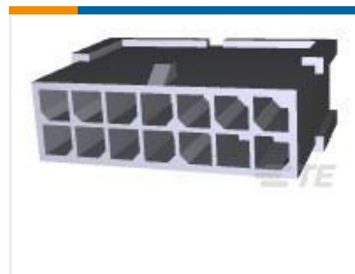
TE 产品编号1-794616-4 FREE HANG DBL ROW HSG 14 POS