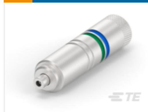
TE 产品编号C0-0258-000-000 POSITIONING INSERT FOR 1 MM CONTACTS