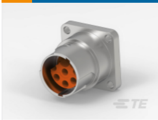
TE 产品编号EEA201N00000500000 915 ITEC RECEPTACLE