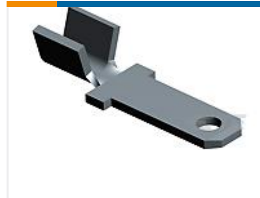
TE 产品编号62384-1 110 FASTON TAB 22-18 AWG TPBR