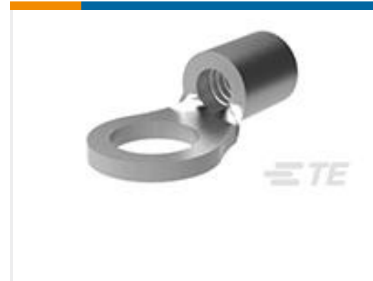
TE 产品编号32858 TERMINAL,BUDG R 26-22 6