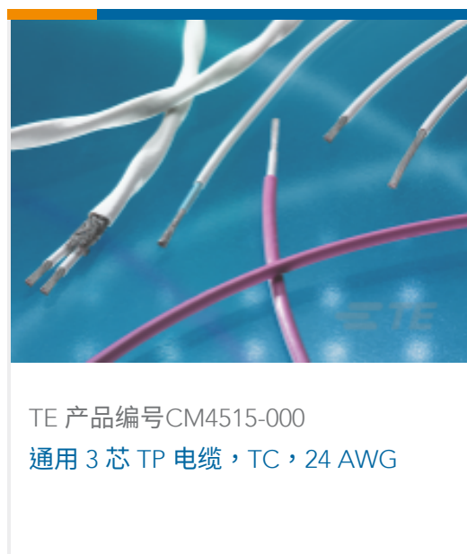
TE 产品编号CM4515-000 通用 3 芯 TP 电缆，TC，24 AWG