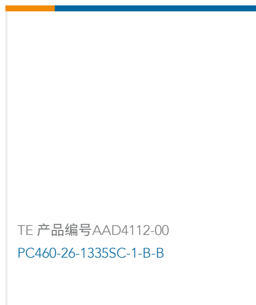
TE 产品编号AAD4112-00 PC460-26-1335SC-1-B-B