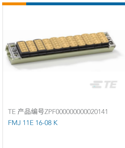
TE 产品编号ZPF00000000020141 FMJ 11E 16-08 K