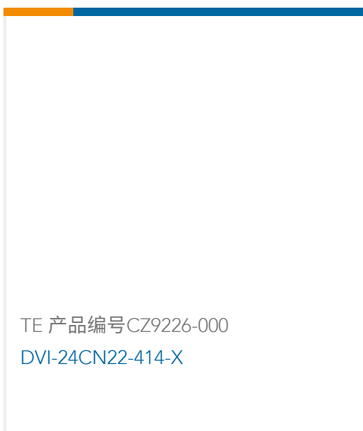
TE 产品编号CZ9226-000 DVI-24CN22-414-X