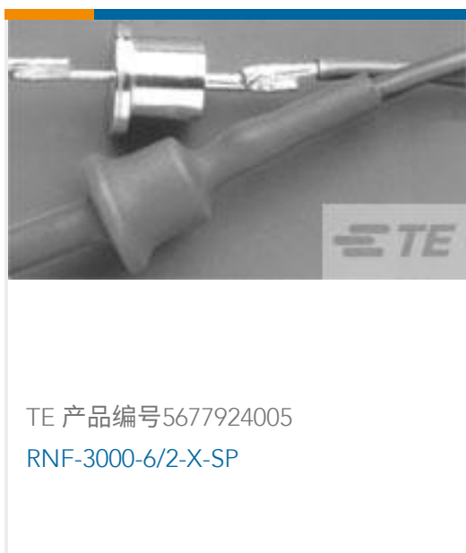
TE 产品编号5677924005 RNF-3000-6/2-X-SP