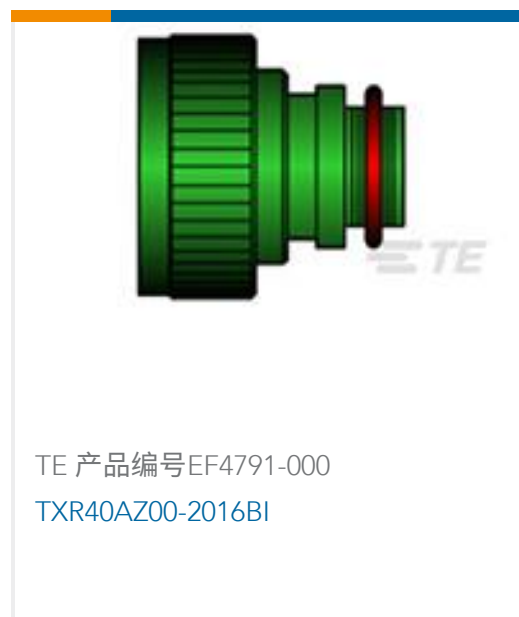
TE 产品编号EF4791-000 TXR40AZ00-2016BI