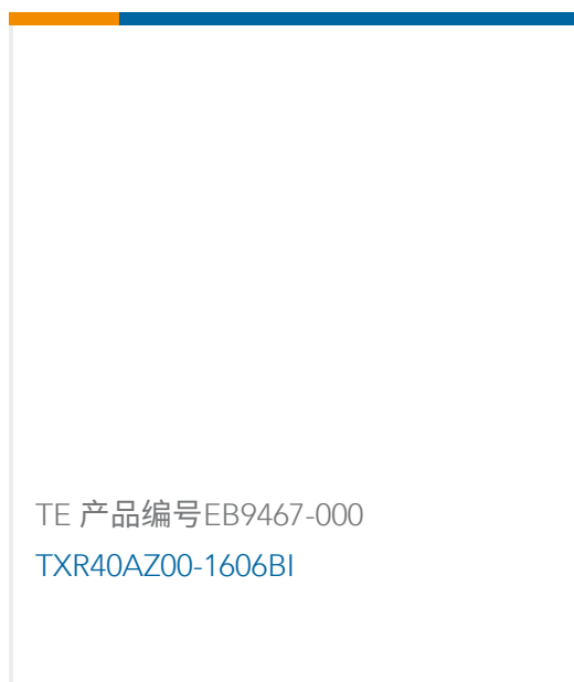
TE 产品编号EB9467-000 TXR40AZ00-1606BI