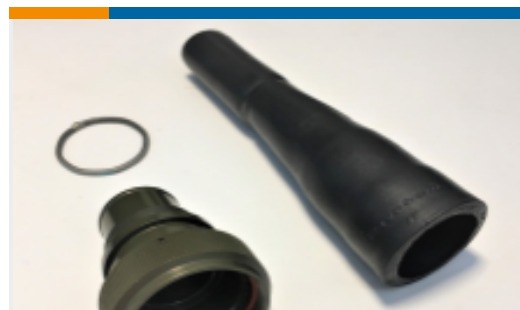
TE 产品编号743100-000 5420-00-230010