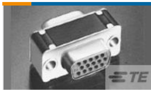
TE 产品编号212561-1 CONN SAVER, SZ 3, AMPLIMITE