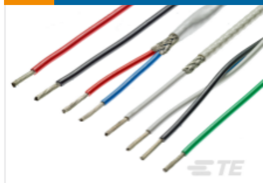
TE 产品编号472967-000 CTC-0018-22-9/5-9CS2340