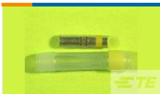
TE 产品编号 650076-000 D-436-38