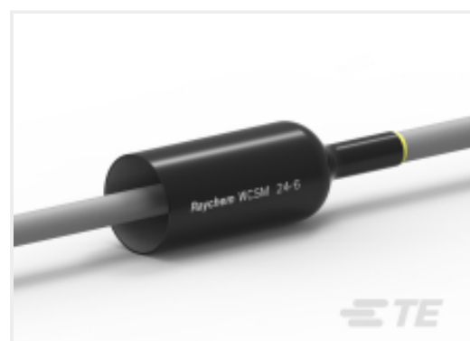
TE 产品编号CU9289-000 WCSM-24/6-1000/S(S20)