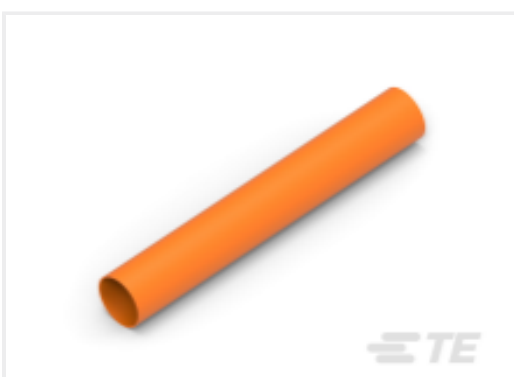
TE 产品编号CAT-HST-ATUM1 ATUM 4:1 热缩管