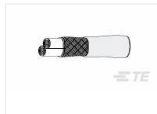
TE 产品编号3765893001 44A1121-22-0/2-0