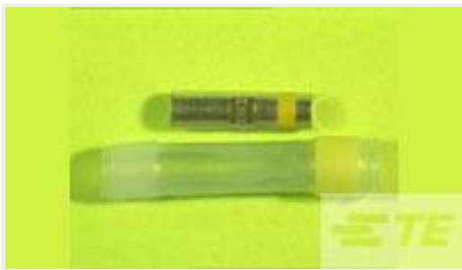
TE 产品编号 650075-000 D-436-37