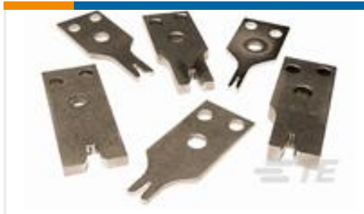
TE 产品编号1-937188-0 WIRE CRIMPER