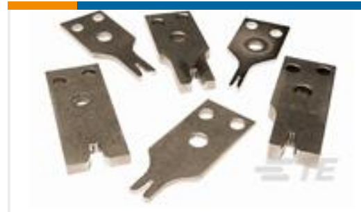
TE 产品编号937188-9 CRIMPER,WIRE