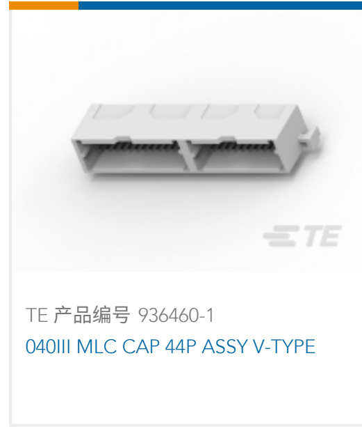
TE 产品编号 936460-1 040III MLC CAP 44P ASSY V-TYPE