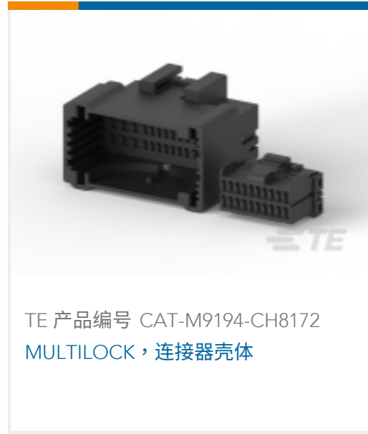
TE 产品编号 CAT-M9194-CH8172 MULTILOCK, 连接器壳体