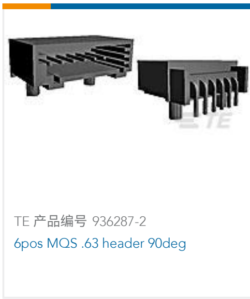
TE 产品编号 936287-2 6pos MQS .63 header 90deg