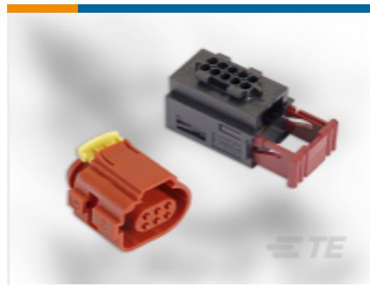
TE 产品编号936421-2 Timer Connector Housing