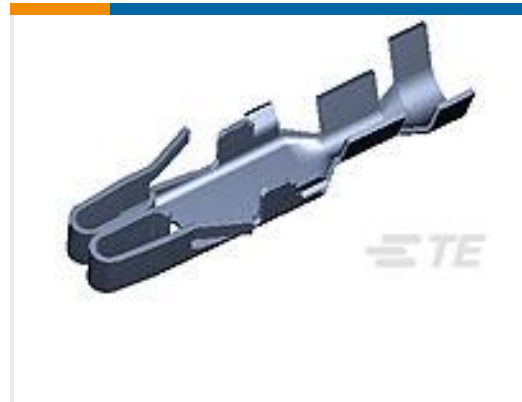
TE 产品编号880397-2 FUSE CONTACT