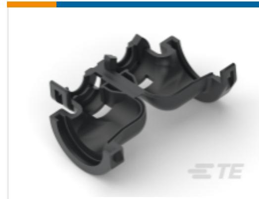
TE 产品编号1-1801468-1 COVER, ROTATIVE, 3 WAY HP CONNECTOR