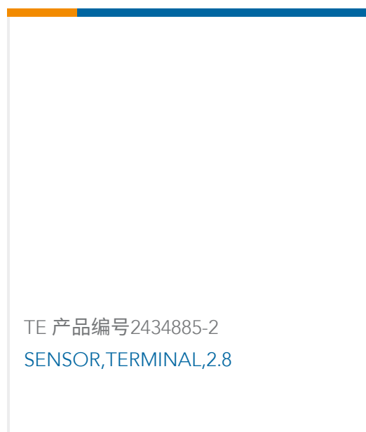
TE 产品编号2434885-2 SENSOR,TERMINAL,2.8