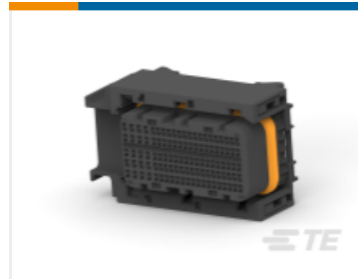
TE 产品编号1-2208720-1 105POS,MCON 1.2 CB,REC HSG, ASSY,SLD