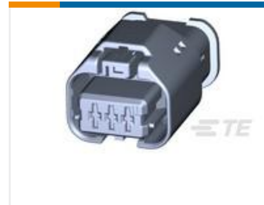
TE 产品编号1801178-3 3W RECEPTACLE HP CONNECTOR GREY