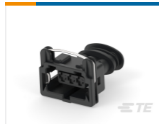
TE 产品编号2137216-1 3P SPLASH PROOF CONNECTOR ASS'