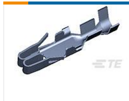
TE 产品编号880398-2 FUSE CONTACT