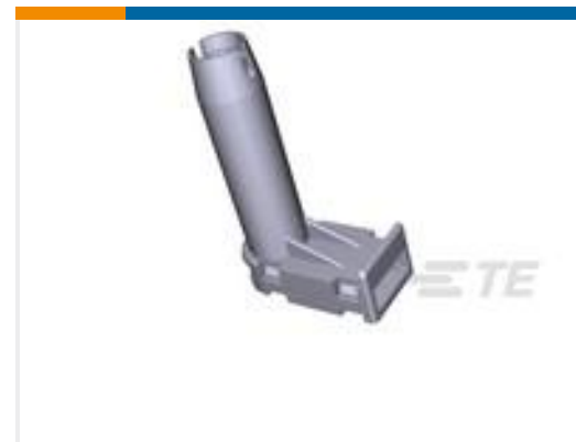
TE 产品编号1743550-2 GLOW PLUG 1P HSG