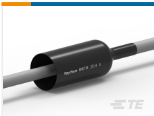
TE 产品编号651145-000 MWTM-25/8-A/U-4(S40)