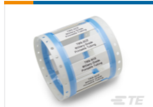
TE 产品编号7385170001 TMS-SCE Military Grade Sleeves