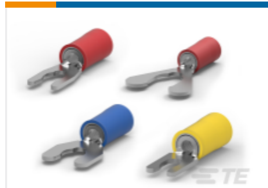
TE 产品编号52939 PIDG Short Spring Spade Tongue Terminals