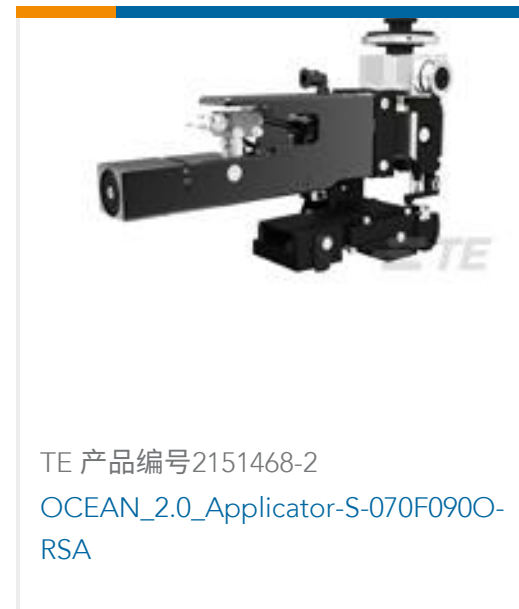
TE 产品编号2151468-2 OCEAN_2.0_Applicator-S-070F0900- RSA