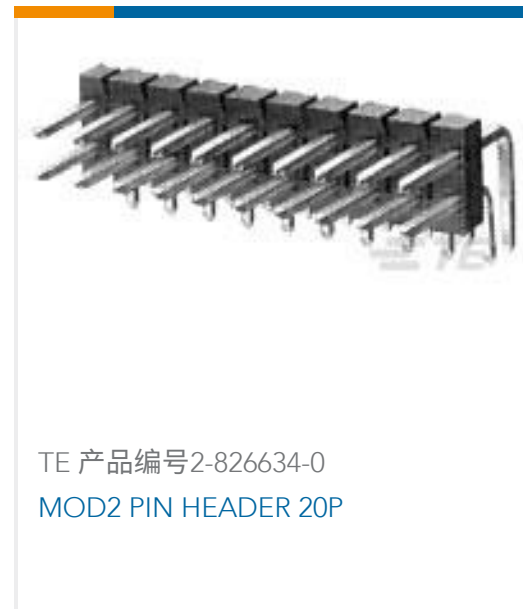
TE 产品编号2-826634-0 MOD2 PIN HEADER 20P