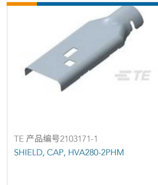
TE 产品编号2103171-1 SHIELD, CAP, HVA280-2PHM