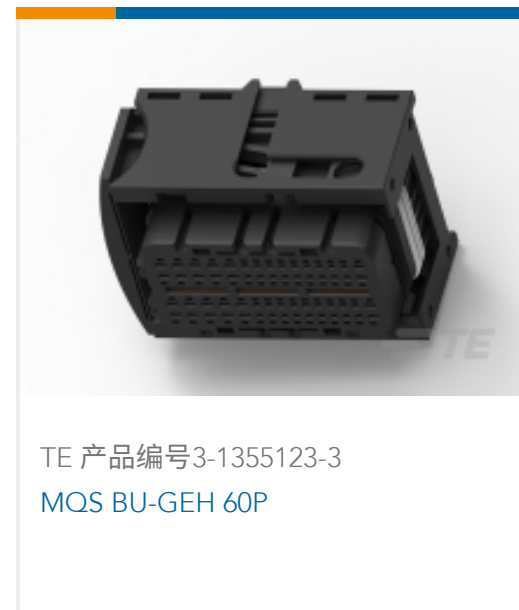
TE 产品编号3-1355123-3 MQS BU-GEH 60P