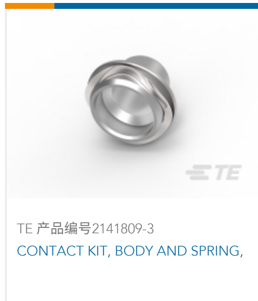
TE 产品编号2141809-3 CONTACT KIT, BODY AND SPRING,