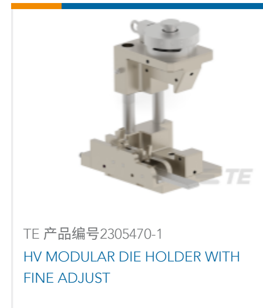
TE 产品编号2305470-1 HV MODULAR DIE HOLDER WITH FINE ADJUST