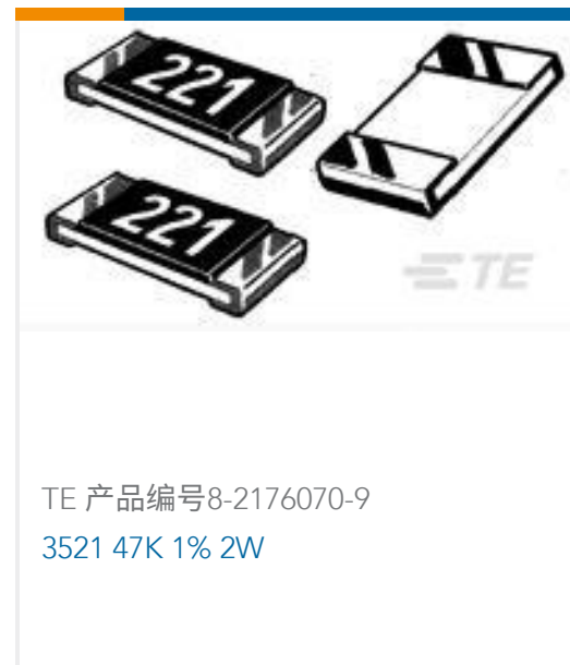
TE 产品编号8-2176070-9 3521 47K 1% 2W