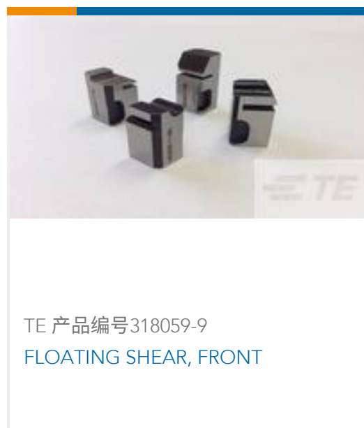
TE 产品编号318059-9 FLOATING SHEAR, FRONT