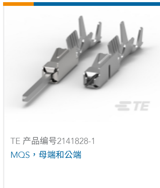
TE 产品编号2141828-1 MQS, 母端和公端