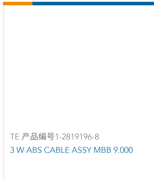
TE 产品编号1-2819196-8 3 W ABS CABLE ASSY MBB 9.000