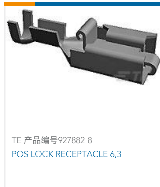
TE 产品编号927882-8 POS LOCK RECEPTACLE 6,3