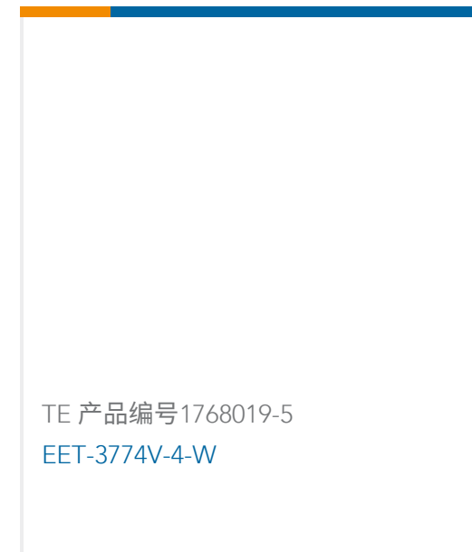
TE 产品编号1768019-5 EET-3774V-4-W