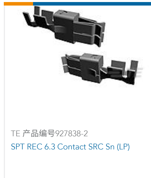
TE 产品编号927838-2 SPT REC 6.3 Contact SRC Sn (LP)