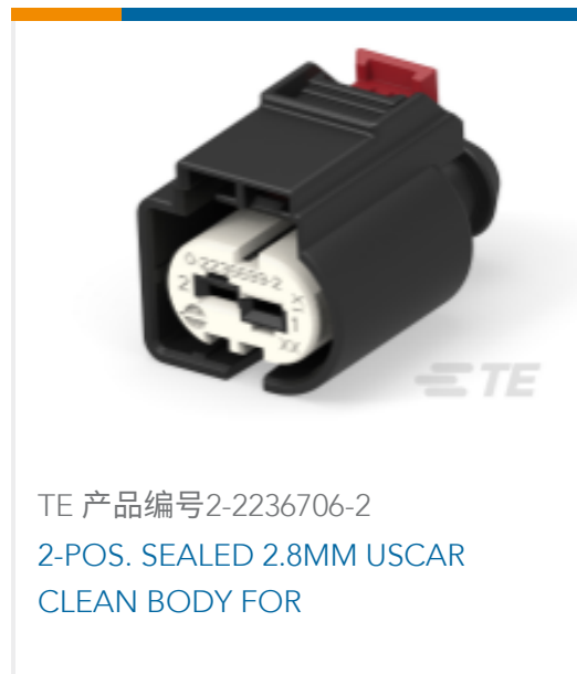
TE 产品编号2-2236706-2 2-POS. SEALED 2.8MM USCAR CLEAN BODY FOR