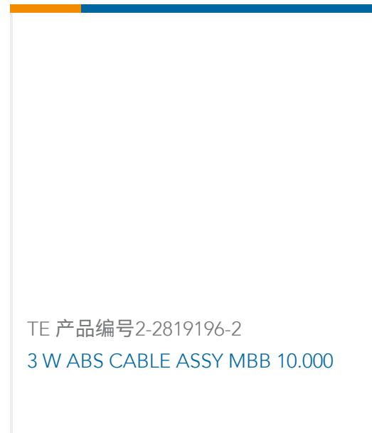
TE 产品编号2-2819196-2 3 W ABS CABLE ASSY MBB 10.000