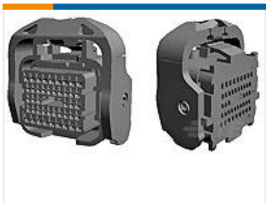
TE 产品编号1717138-4 025/040 SEALED 44POS PLUG ASSY