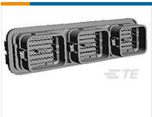
TE 产品编号1717139-1 025/040 SEALED 132POS CAP ASSY