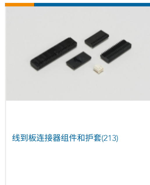
线到板连接器组件和护套(213)