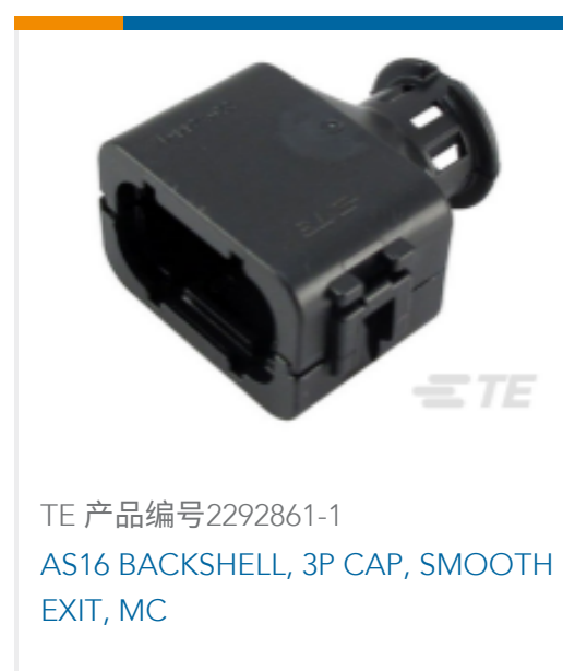
TE 产品编号2292861-1 AS16 BACKSHELL, 3P CAP, SMOOTH EXIT, MC