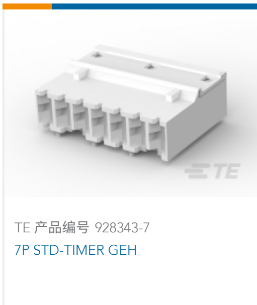
TE 产品编号 928343-7 7P STD-TIMER GEH