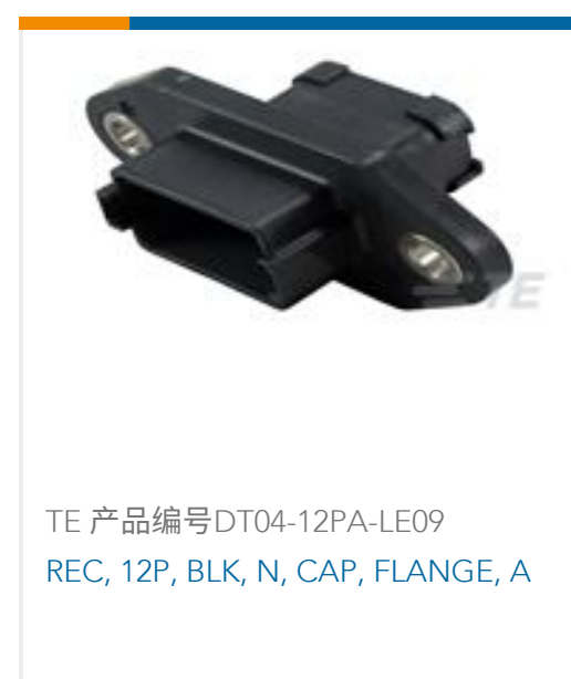
TE 产品编号DT04-12PA-LE09 REC, 12P, BLK, N, CAP, FLANGE, A