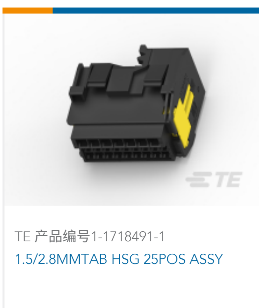
TE 产品编号1-1718491-1 1.5/2.8MMTAB HSG 25POS ASSY