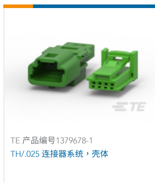
TE 产品编号1379678-1 TH/.025 连接器系统, 壳体