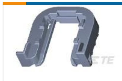
TE 产品编号1703810-2 SLIDE,TAB HSG GROUP B