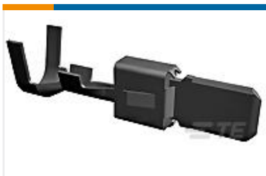
TE 产品编号1-962918-1 TAB 5.8x0.8 CONTACT CS SWS Sn