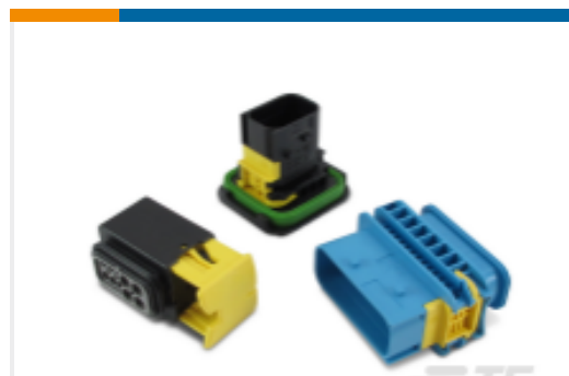
TE 产品编号4-1564337-1 重载密封系列连接器塑壳