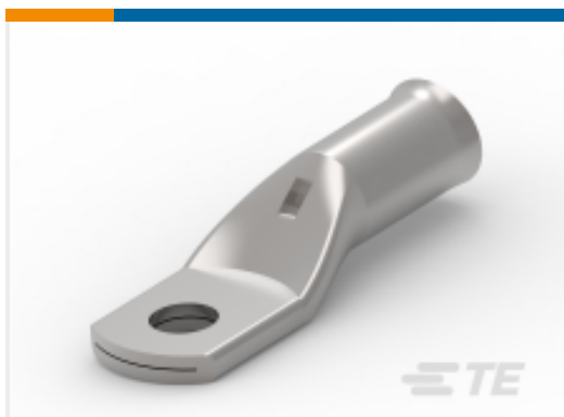
TE 产品编号710036-3 XCT 35-10