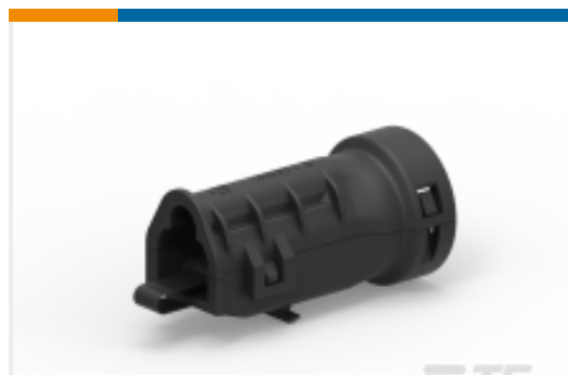
TE 产品编号1418917-1 MULTI CORE CABLE ADAPTER 180 DEGREE