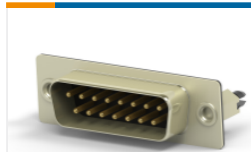
TE 产品编号2301828-1 AMPL PLUG HD20, VERT, 15P, B/L, 4-40 INS