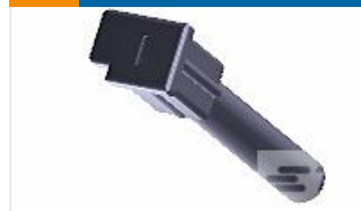
TE 产品编号1-1452424-1 BLIND PLUG FOR MCON 1.2 CB (0,