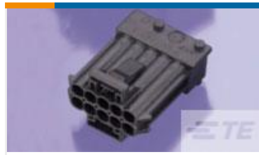
TE 产品编号1-965423-1 TAB HOUSING2,8 10POS