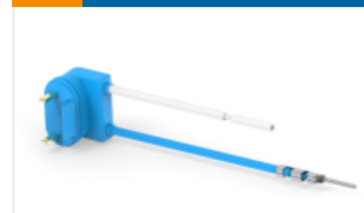
TE 产品编号773119-4 EDS OVERMOLDED 2P ASSY, BLUE