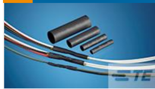
TE 产品编号0021036015 RBK-ILS-125-NR3-0-27MM