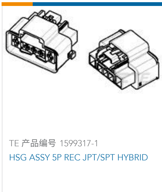
TE 产品编号 1599317-1 HSG ASSY 5P REC JPT/SPT HYBRID