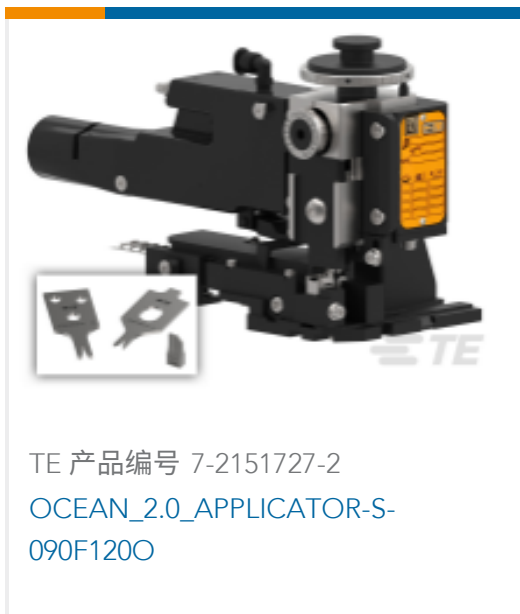
TE 产品编号 7-2151727-2 OCEAN_2.0_APPLICATOR-S-090F120O