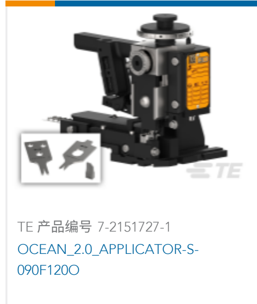
TE 产品编号 7-2151727-1 OCEAN_2.0_APPLICATOR-S-090F120O