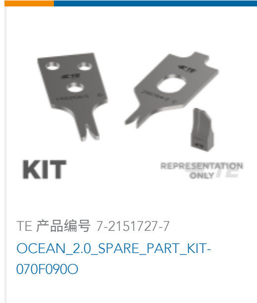
TE 产品编号 7-2151727-7 OCEAN_2.0_SPARE_PART_KIT-070F090O