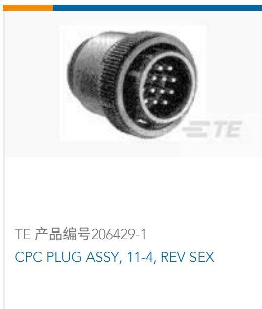
TE 产品编号 206429-1 CPC PLUG ASSY, 11-4, REV SEX