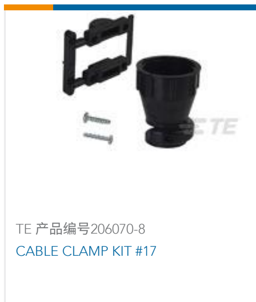
TE 产品编号 206070-8 CABLE CLAMP KIT #17