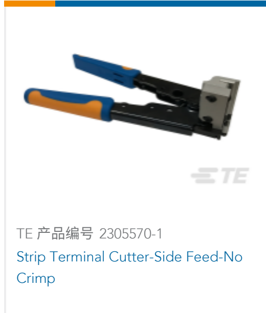
TE 产品编号 2305570-1 Strip Terminal Cutter-Side Feed-No Crimp