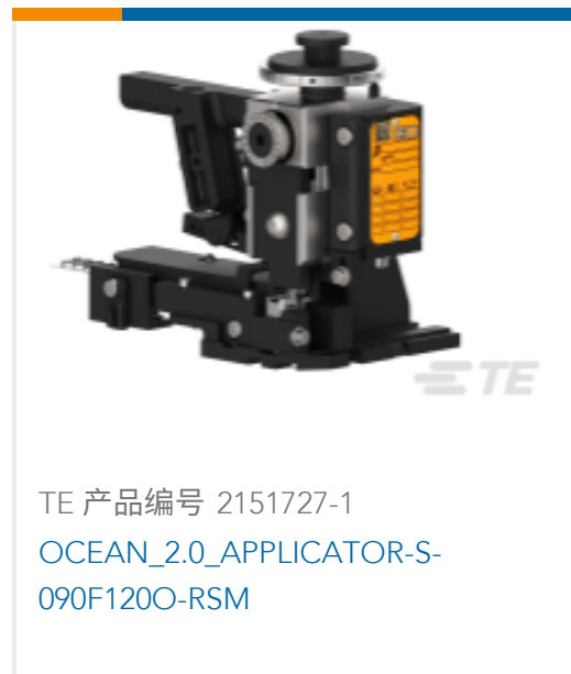
TE 产品编号 2151727-1 OCEAN_2.0_APPLICATOR-S-090F120O-RSM