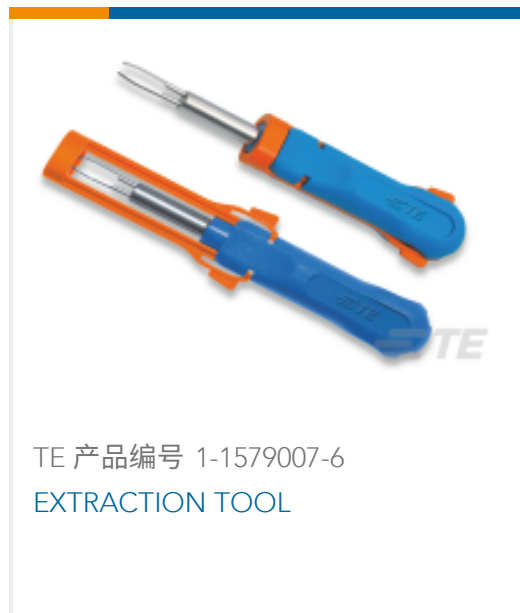
TE 产品编号 1-1579007-6 EXTRACTION TOOL