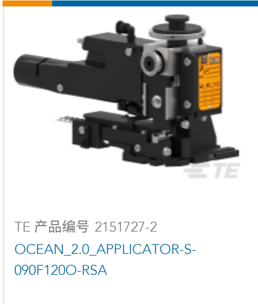
TE 产品编号 2151727-2 OCEAN_2.0_APPLICATOR-S-090F120O-RSA