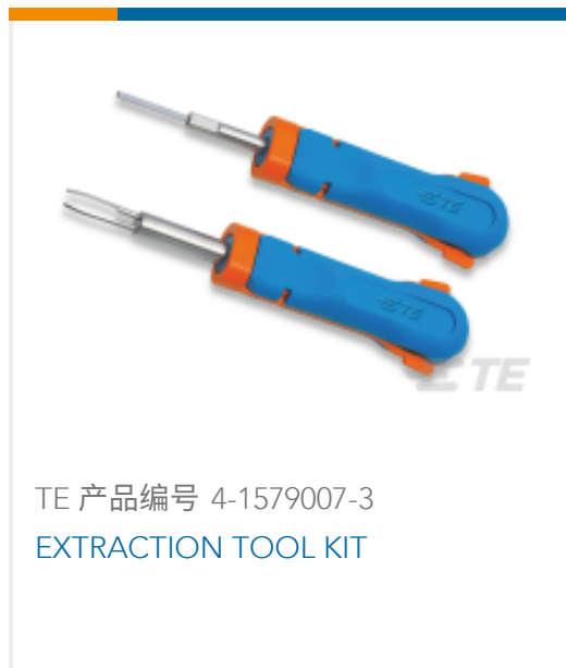
TE 产品编号 4-1579007-3 EXTRACTION TOOL KIT