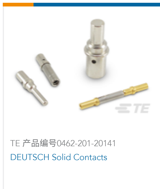
TE 产品编号 0462-201-20141 DEUTSCH Solid Contacts