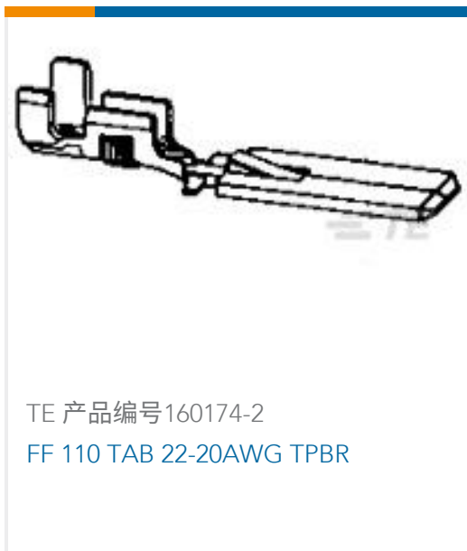
TE 产品编号160174-2 FF 110 TAB 22-20AWG TPBR