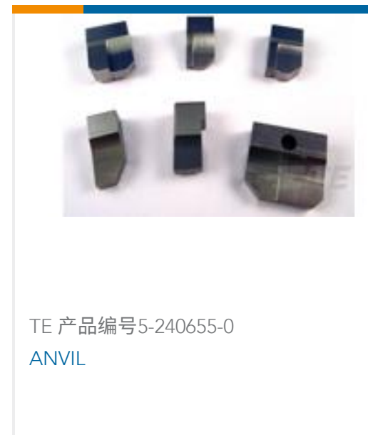
TE 产品编号5-240655-0 ANVIL