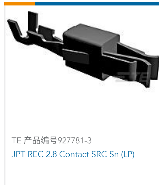
TE 产品编号927781-3 JPT REC 2.8 Contact SRC Sn (LP)