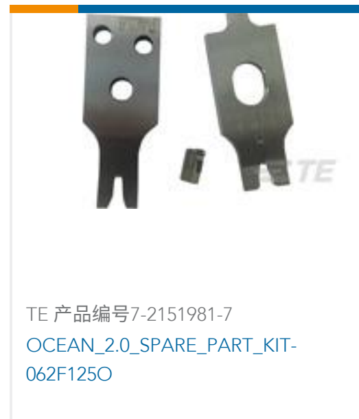
TE 产品编号7-2151981-7 OCEAN_2.0_SPARE_PART_KIT-062F125O