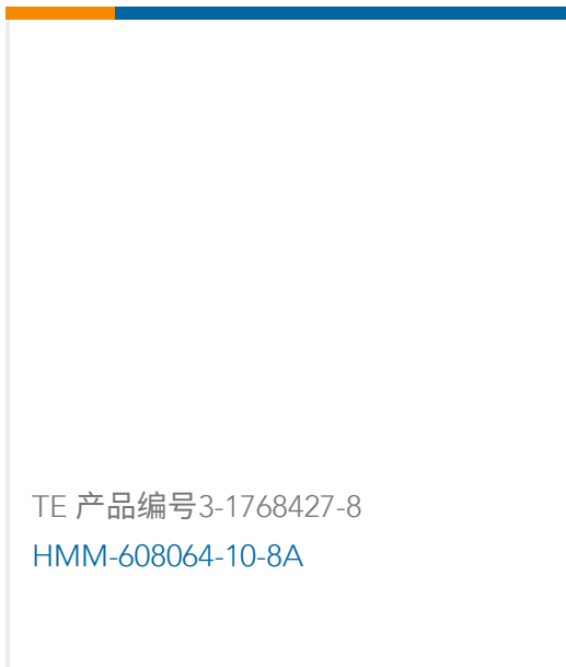
TE 产品编号3-1768427-8 HMM-608064-10-8A