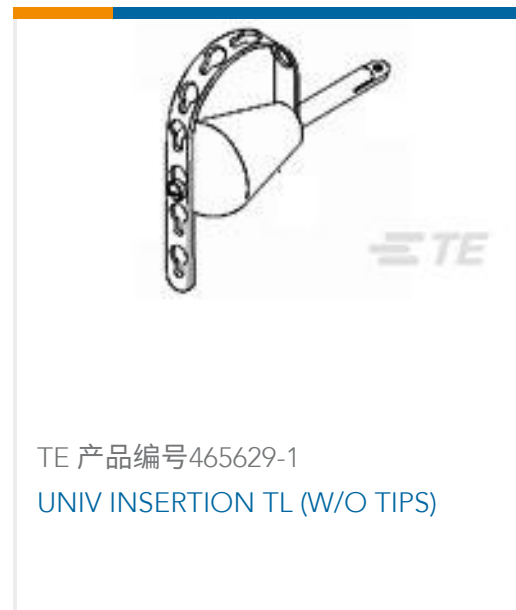
TE 产品编号465629-1 UNIV INSERTION TL (W/O TIPS)