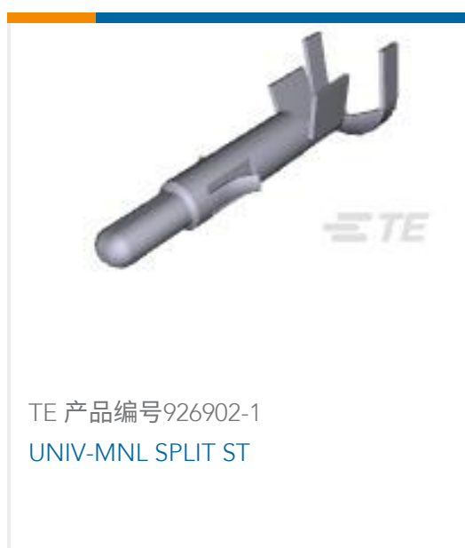
TE 产品编号926902-1 UNIV-MNL SPLIT ST