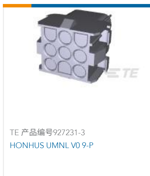
TE 产品编号927231-3 HONHUS UMNL V0 9-P