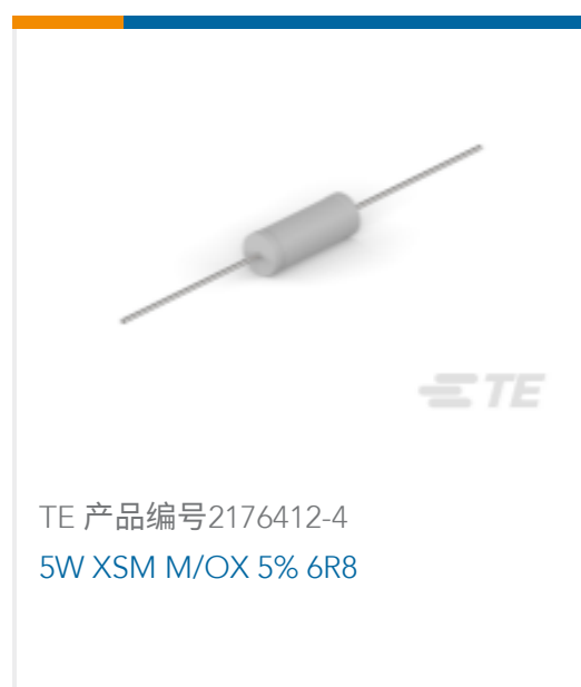
TE 产品编号2176412-4 5W XSM M/OX 5% 6R8