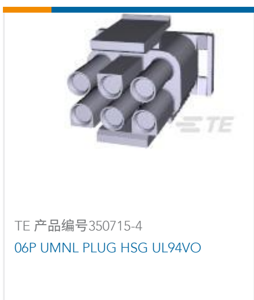
TE 产品编号350715-4 06P UMNL PLUG HSG UL94VO