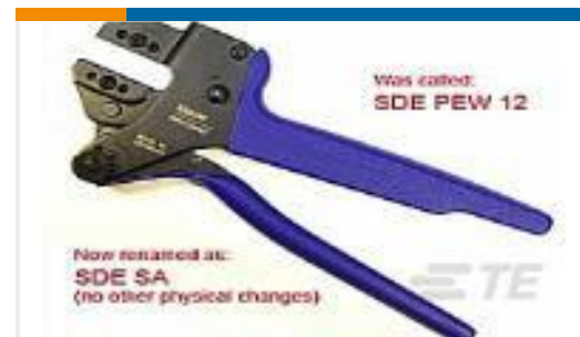
TE 产品编号1752938-1 PEW 12 TOOL(3-5MM MATE-N-LOK)