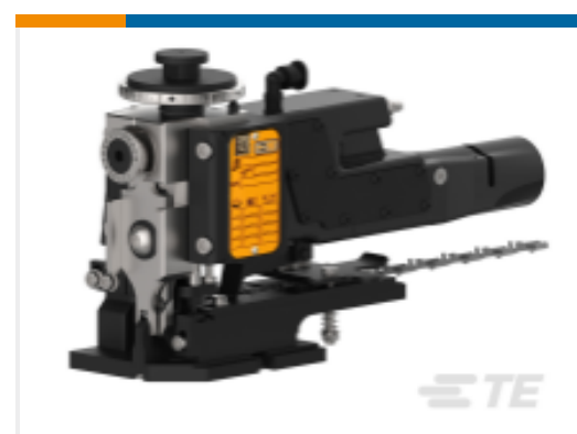
TE 产品编号2150603-2 OCEAN_2.0_Applicator-E-090F130F-REA