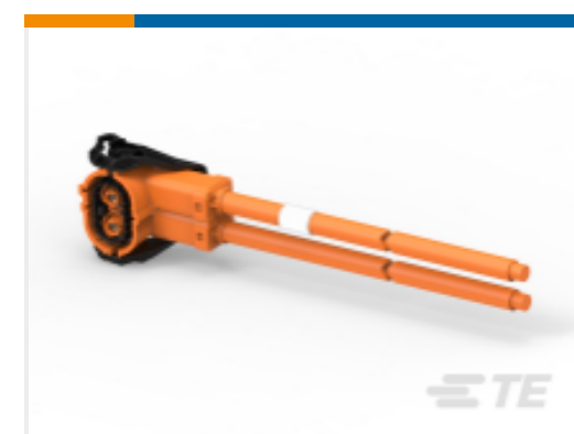
TE 产品编号1-2286946-4 2POS,HVP800,90 DEG,35 SQMM,COD A