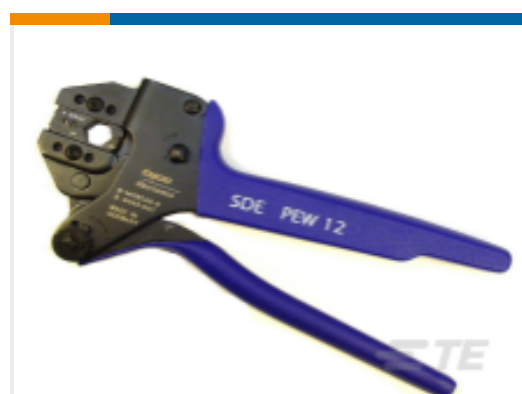
TE 产品编号2031243-1 SDE PEW 12 TL & DIE MIC 1