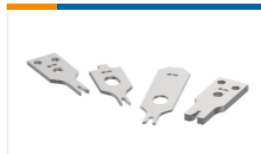
TE 产品编号1803090-1 CRIMPER, INSUL. F, SPECIAL