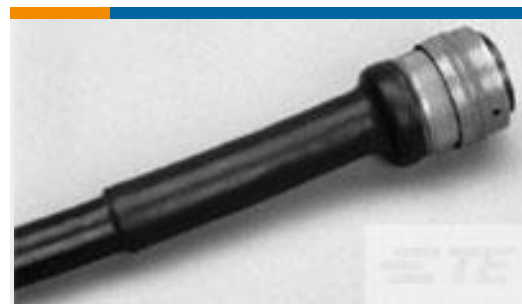
TE 产品编号CV67236001 ATUM-24/8-2-40MM