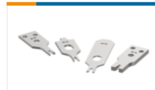
TE 产品编号1803090-2 CRIMPER, INSUL. F, SPECIAL