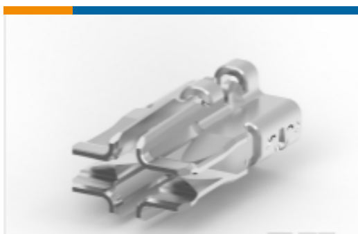
TE 产品编号968910-2 9,5CROSS CONTACT F.STAMPED CIRCUIT 0.8MM