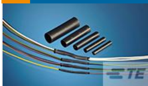
TE 产品编号CV13236001 QSZH-125-NR4-80MM