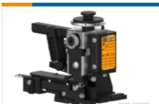
TE 产品编号5-2151036-1 OCEAN_2.0_APPPLICATOR-S- 055F1250