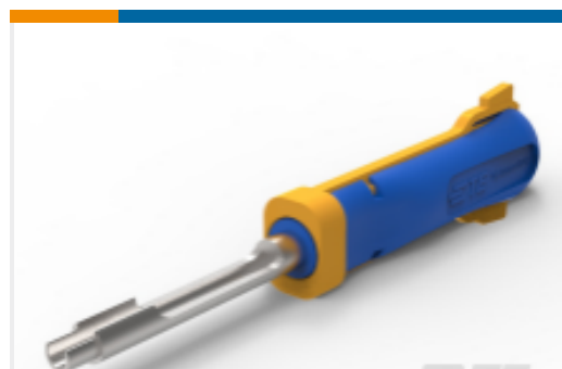
TE 产品编号951768-1 EXTRACTOR TOOL FOR SICMA2