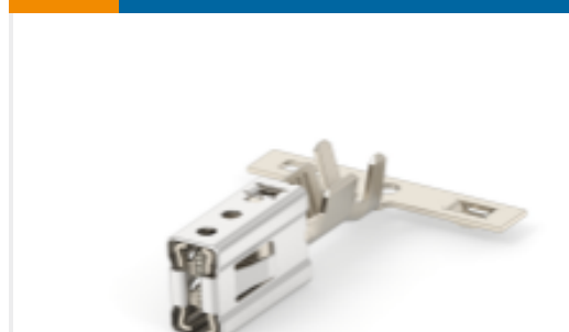
TE 产品编号1-2333550-3 AMP MCP 6.3/4.8K, TERMINAL, FUSE 0.81