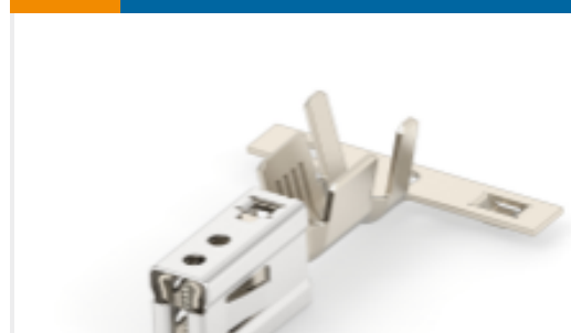
TE 产品编号1-2333552-3 AMP MCP 6.3/4.8K, TERMINAL, FUSE 0.81