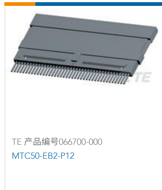
TE 产品编号066700-000 MTC50-EB2-P12