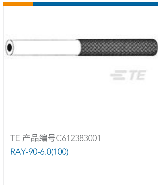
TE 产品编号C612383001 RAY-90-6.0(100)