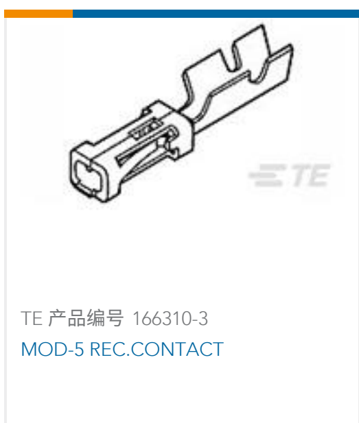
TE 产品编号 166310-3 MOD-5 REC.CONTACT