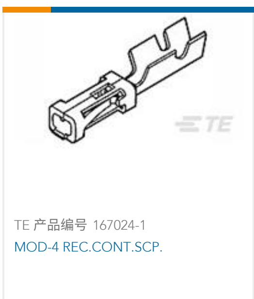
TE 产品编号 167024-1 MOD-4 REC.CONT.SCP.