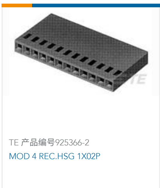
TE 产品编号925366-2 MOD 4 REC.HSG 1X02P