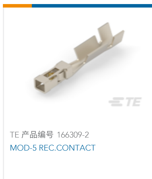
TE 产品编号 166309-2 MOD-5 REC.CONTACT