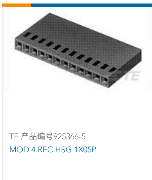
TE 产品编号925366-5 MOD 4 REC.HSG 1X05P