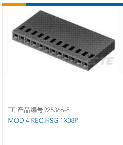
TE 产品编号925366-8 MOD 4 REC.HSG 1X08P