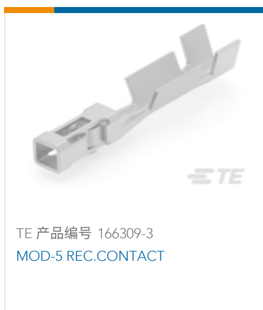
TE 产品编号 166309-3 MOD-5 REC.CONTACT