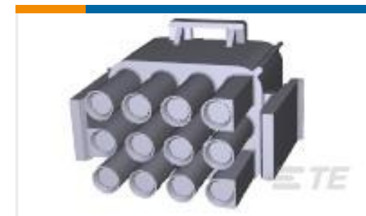
TE 产品编号350735-4 12P UMNL PLUG HSG UL94VO