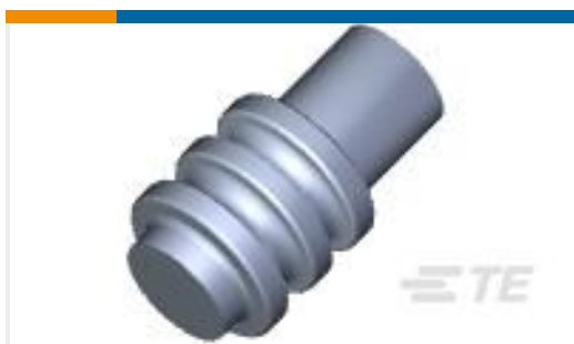
TE 产品编号794995-1 MINI UMNL CAVITY PLUG SEAL