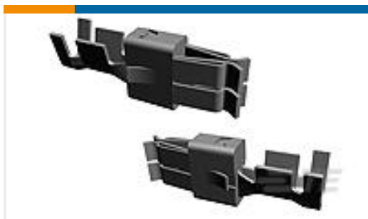
TE 产品编号927837-1 SPT REC 6.3 Contact SRC Sn