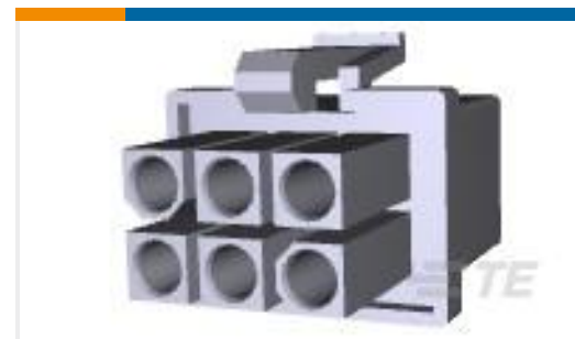
TE 产品编号794895-1 6 CIR MINI UMNL RND WIRE HOLES