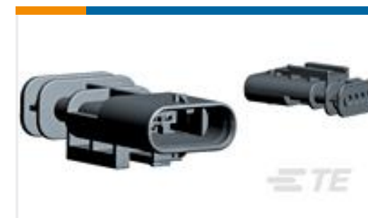
TE 产品编号1-1564559-1 4POS, MCON 1.2 LL TAB SEALED COD A