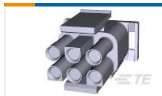
TE 产品编号1-1644055-2 UMNL 6 WAY PLUG HOUSING