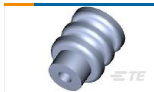
TE 产品编号794758-1 MINI UMNL WIRE SEAL, 18-26AWG