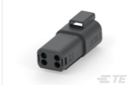
TE 产品编号1-2600030-0 4CCT BLACK RECEP W/LARGE SEAL