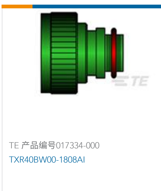
TE 产品编号017334-000 TXR40BW00-1808AI