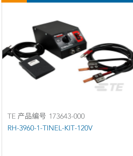
TE 产品编号 173643-000 RH-3960-1-TINEL-KIT-120V