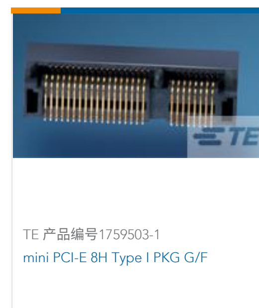
TE 产品编号1759503-1 mini PCI-E 8H Type I PKG G/F