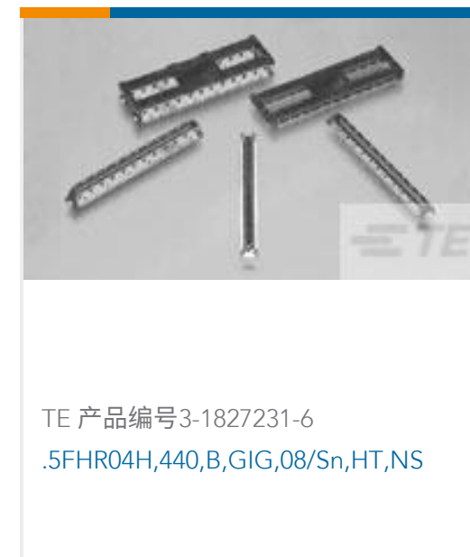
TE 产品编号3-1827231-6 .5FHR04H,440,B,GIG,08/Sn,HT,NS