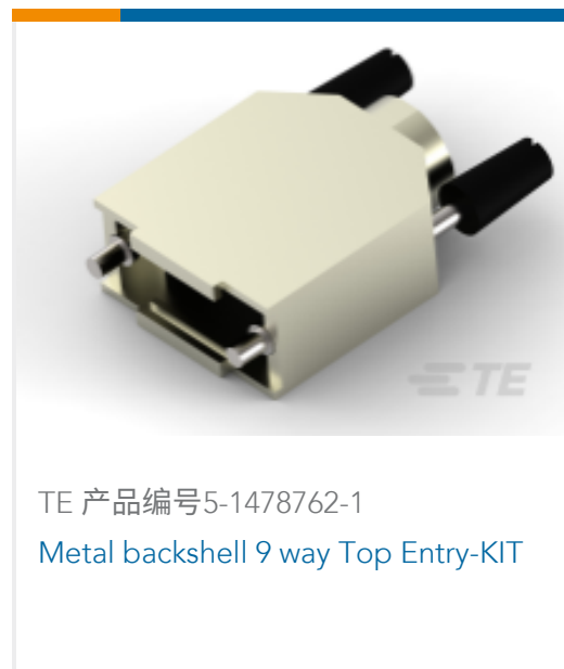
TE 产品编号5-1478762-1 Metal backshell 9 way Top Entry-KIT