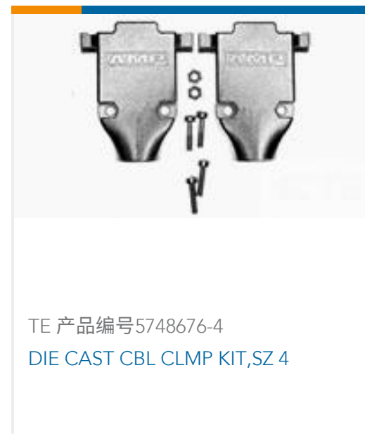
TE 产品编号5748676-4 DIE CAST CBL CLMP KIT,SZ 4