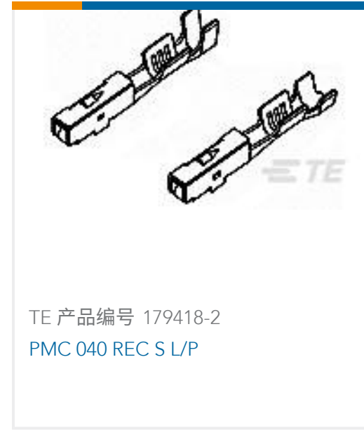
TE 产品编号 179418-2 PMC 040 REC S L/P