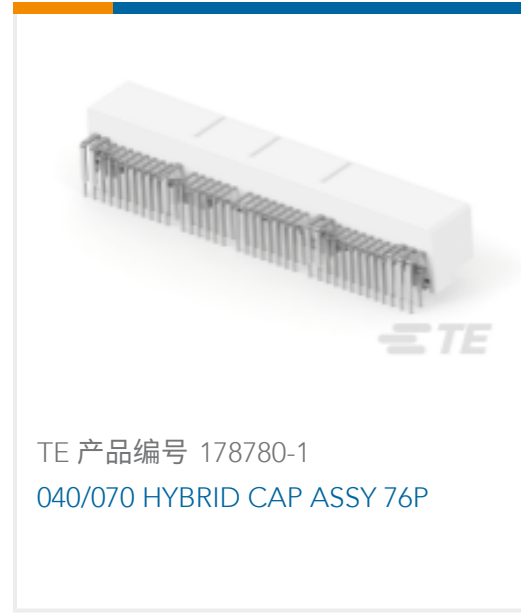
TE 产品编号 178780-1 040/070 HYBRID CAP ASSY 76P