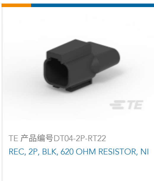
TE 产品编号DT04-2P-RT22 REC, 2P, BLK, 620 OHM RESISTOR, NI