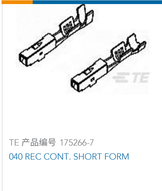
TE 产品编号 175266-7 040 REC CONT. SHORT FORM