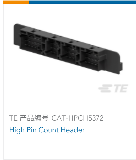
TE 产品编号 CAT-HPCH5372 High Pin Count Header