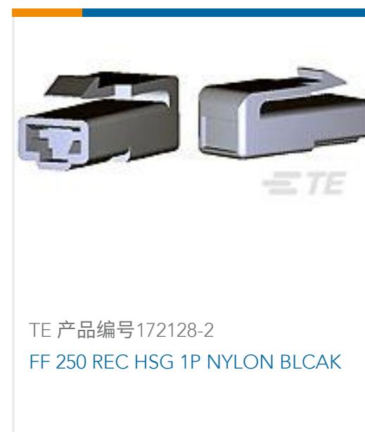
TE 产品编号172128-2 FF 250 REC HSG 1P NYLON BLCAK