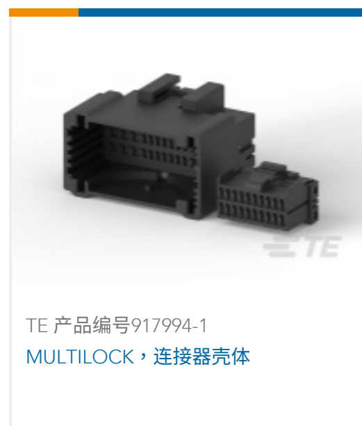
TE 产品编号917994-1 MULTILOCK, 连接器壳体