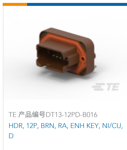
TE 产品编号DT13-12PD-B016 HDR, 12P, BRN, RA, ENH KEY, NI/CU, D