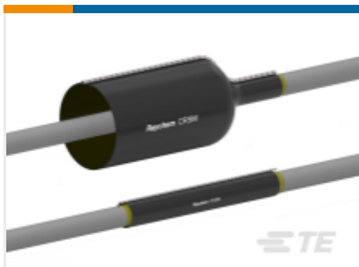
TE 产品编号822895-000 用于电缆维修的拉链套管