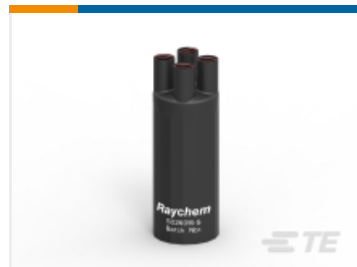
TE 产品编号C52918N001 502K016/S(S5)