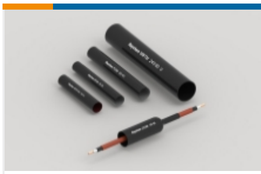
电源电缆管路和附件(299)