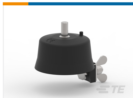
TE 产品编号E08692-000 LVA-280B-AS