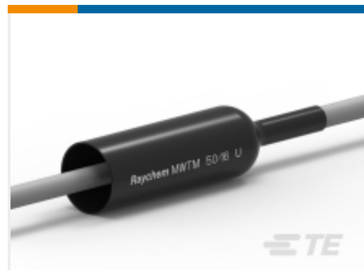
TE 产品编号651145-000 中厚壁热缩管