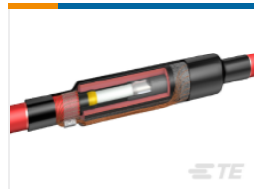
TE 产品编号CA7352-005 MXSU-5151