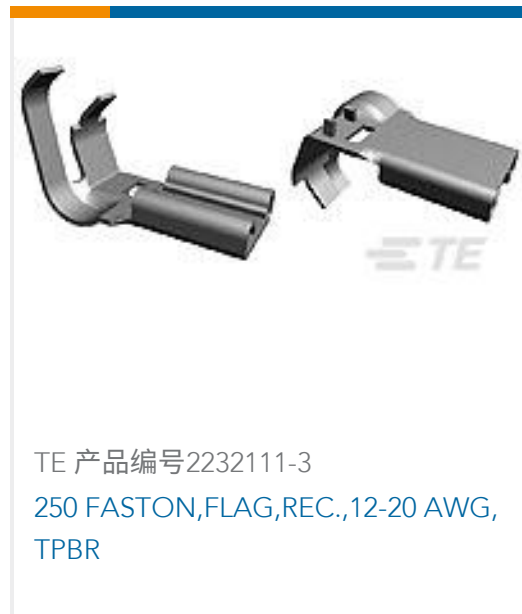
TE 产品编号2232111-3 250 FASTON,FLAG,REC.,12-20 AWG, TPBR