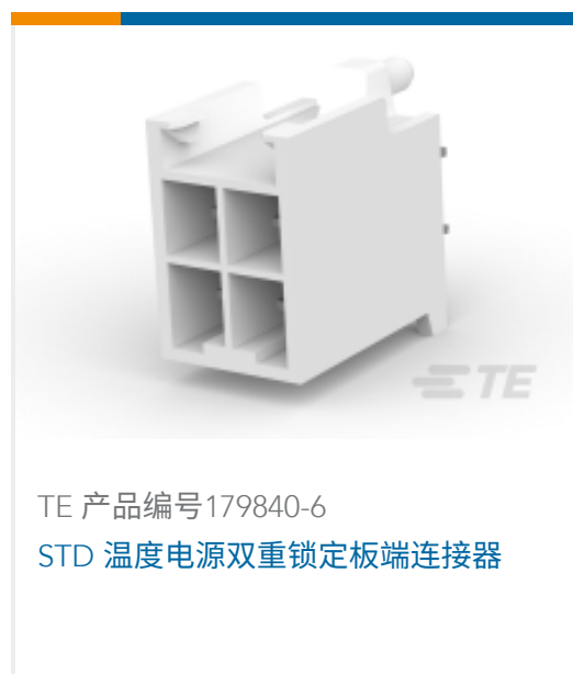
TE 产品编号179840-6 STD 温度电源双重锁定板端连接器