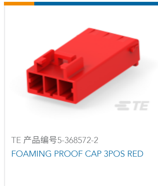
TE 产品编号5-368572-2 FOAMING PROOF CAP 3POS RED