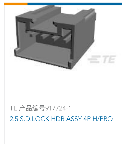
TE 产品编号917724-1 2.5 S.D.LOCK HDR ASSY 4P H/PRO