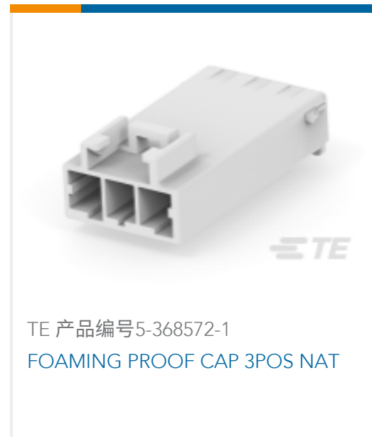
TE 产品编号5-368572-1 FOAMING PROOF CAP 3POS NAT