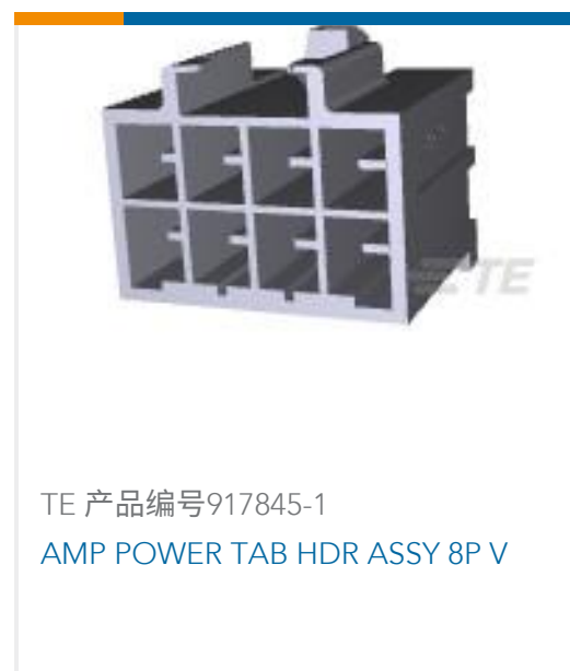
TE 产品编号917845-1 AMP POWER TAB HDR ASSY 8P V