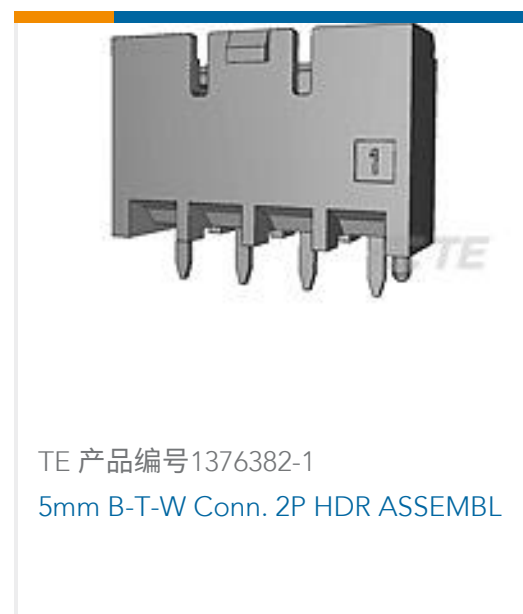
TE 产品编号1376382-1 5mm B-T-W Conn. 2P HDR ASSEMBL