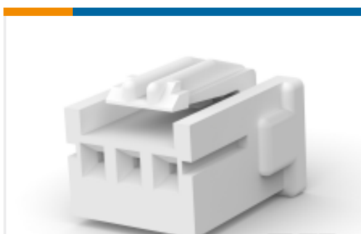
TE 产品编号917691-1 STD 温度信号双锁插头