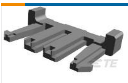
TE 产品编号917700-1 2.5 SIGNAL D/LOCK D.L.P 4P