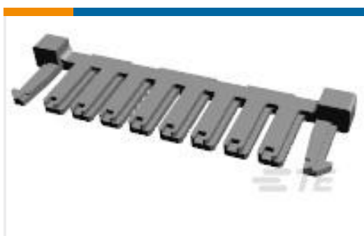
TE 产品编号917706-1 2.5 SIGNAL DBL LOCK DLP 10P