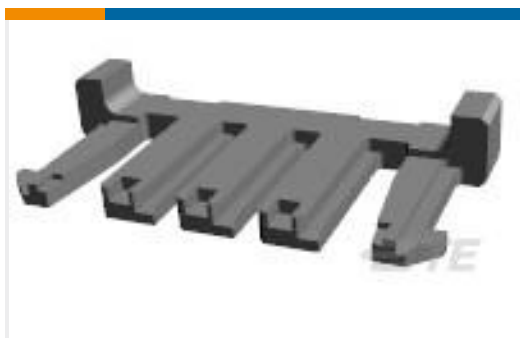
TE 产品编号917701-1 2.5 SIGNAL DBL LOCK DLP 5P