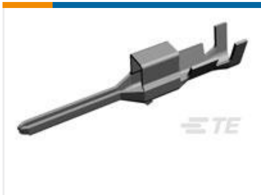
TE 产品编号917765-1 2.5 SIGNAL D/LOCK TAB CONT. M