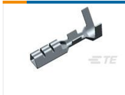
TE 产品编号175065-1 CONTACT 22-18 AWG 0.30 X 17.0 SS