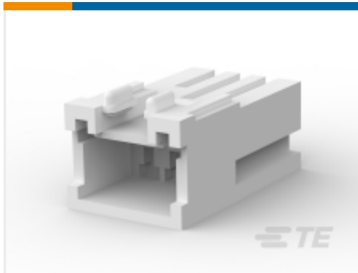
TE 产品编号316091-1 STD 温度信号双锁帽