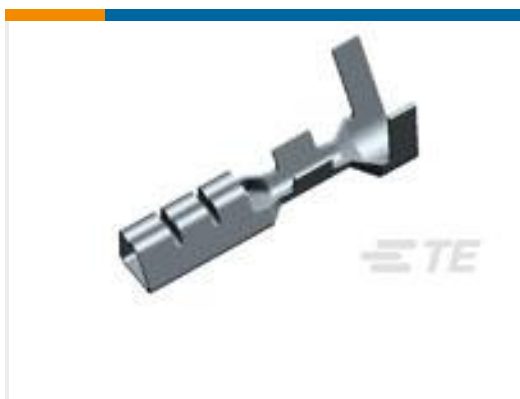
TE 产品编号175065-2 CONTACT 22-18 AWG 0.30 X 17.0 SS