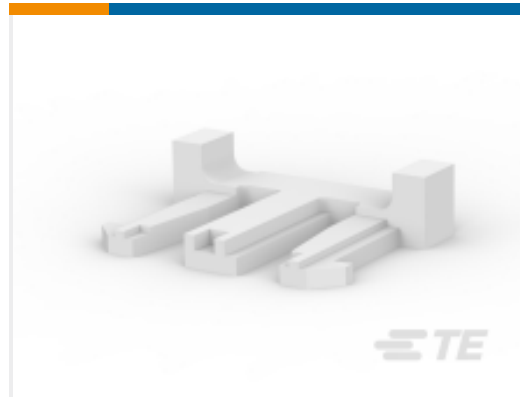
TE 产品编号917702-1 信号双锁端子锁定片