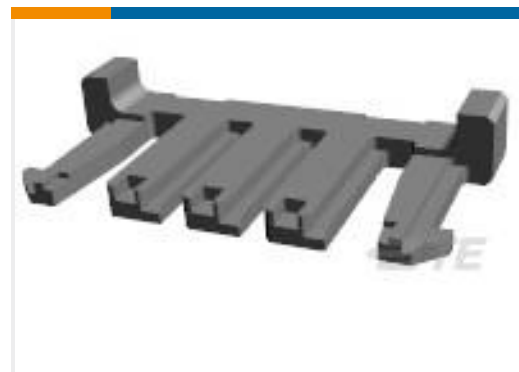
TE 产品编号917701-1 2.5 SIGNAL DBL LOCK DLP 5P