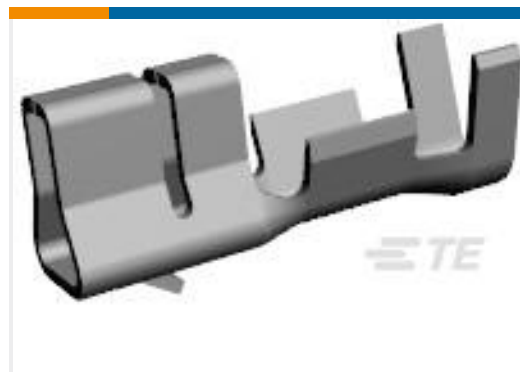
TE 产品编号917684-1 2.5 SIGNAL DBL LOCK REC CONT M