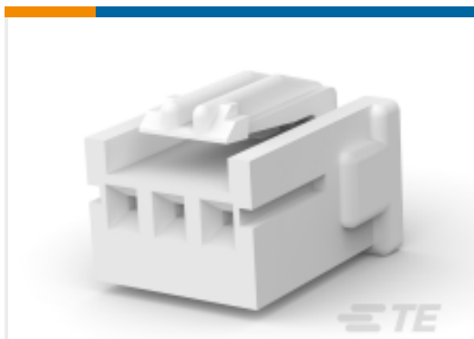
TE 产品编号917686-2 STD 温度信号双锁插头