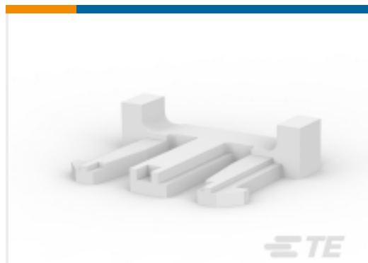
TE 产品编号917702-1 信号双锁端子锁定片