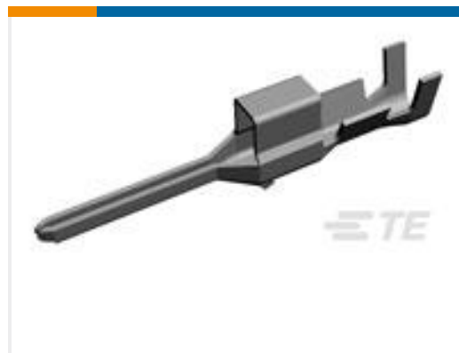
TE 产品编号917765-1 2.5 SIGNAL D/LOCK TAB CONT. M