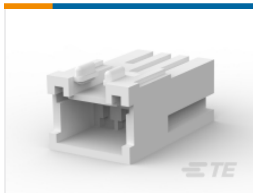
TE 产品编号316086-2 STD 温度信号双锁帽