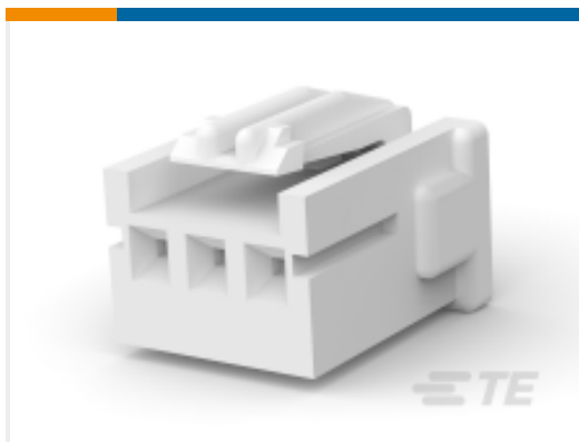
TE 产品编号917686-2 STD 温度信号双锁插头