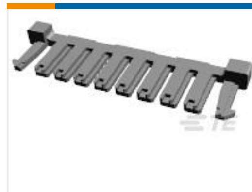
TE 产品编号917706-1 2.5 SIGNAL DBL LOCK DLP 10P