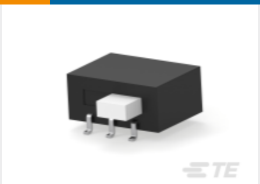
TE 产品编号1-1437581-1 ASE22RL=AUTOSLIDE DP