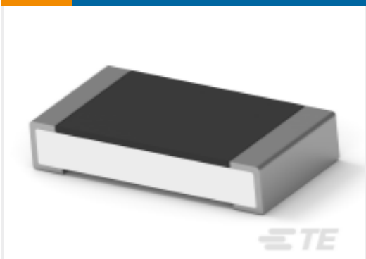
TE 产品编号4-2176391-7 RQ 1206 37K4 0.1% 10PPM 5K RL