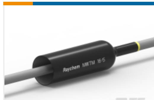
TE 产品编号F17194-000 MWTM-16/5-1000-23/S