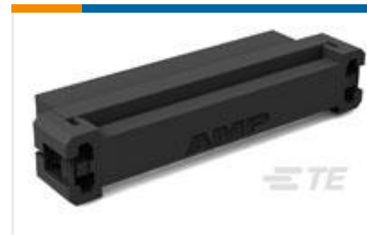
TE 产品编号2-111623-6 50, 2MM, POL,30 DP, LEAD FREE