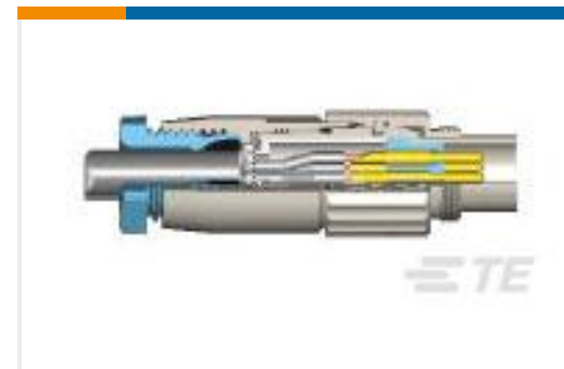
TE 产品编号1-1437719-5 T01-0550-P03-MALE PLUG CONNECTOR SOLDER