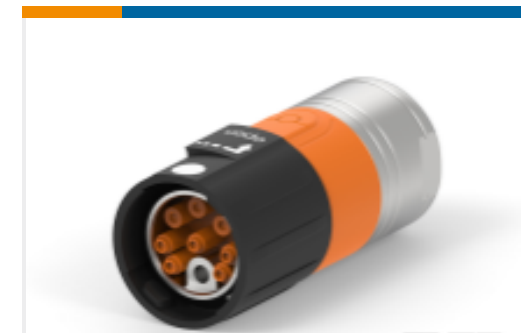
TE 产品编号ESA202N00320500000 915 PLUG