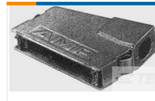
TE 产品编号5749202-2 50 50SR KIT,75D,UK