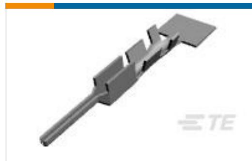
TE 产品编号1-794608-0 PIN CONT 20-24 TIN PLATE STRIP