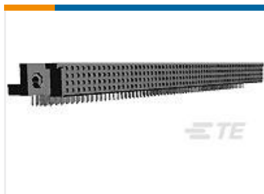
TE 产品编号5532434-6 ASSY,RECPT,R.ANGLE,HDI,LEAD-FR