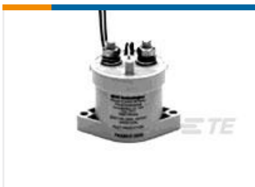
TE 产品编号1-1618002-8 EV200HAANA=RELAY, SPST-NO WITH