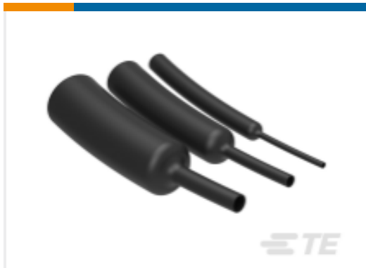
TE 产品编号8638622003 RNF-3000 Heat Shrink Tubing