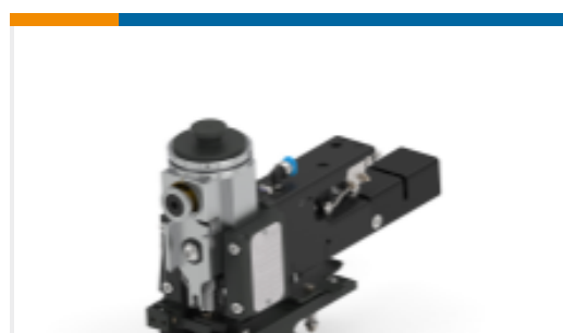
TE 产品编号2150161-1 OCEAN_2.0_Applicator-E-090F130F