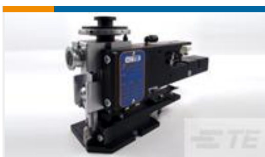
TE 产品编号2150032-2 OCEAN_2.0_APPLICATOR-E-090F155F