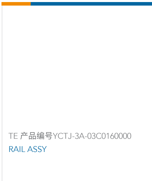
TE 产品编号YCTJ-3A-03C0160000 RAIL ASSY