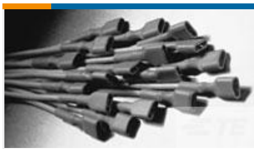
TE 产品编号4847054001 LSTT-12.7-0-SP