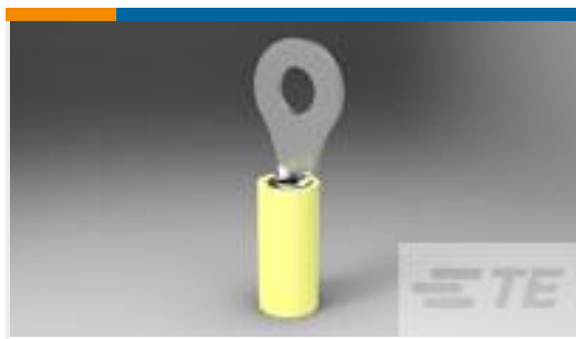
TE 产品编号320567 TERMINAL,PIDG R 12-10 6