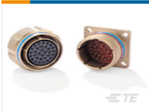
TE 产品编号ZPF000000000087850 DTB 24 B 19-35 AN