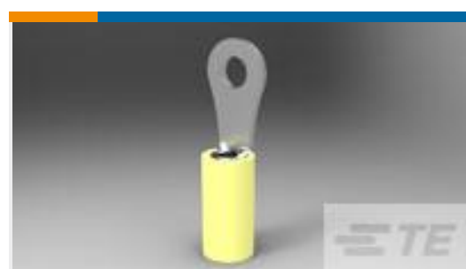
TE 产品编号35148 TERMINAL,PIDG R 12-10 4