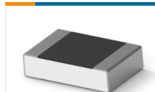
TE 产品编号8-2176381-8 RQ 0805 100K 0.1% 10PPM 5K RL