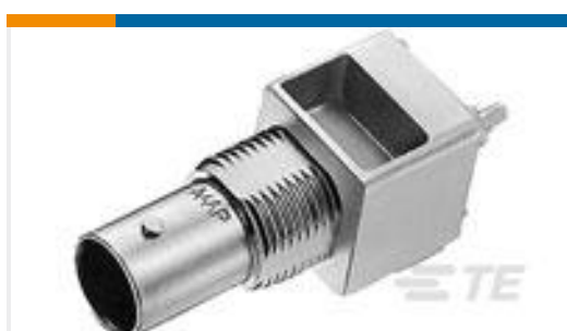
TE 产品编号227673-1 BNC PCB VERTICAL JACK W/POST