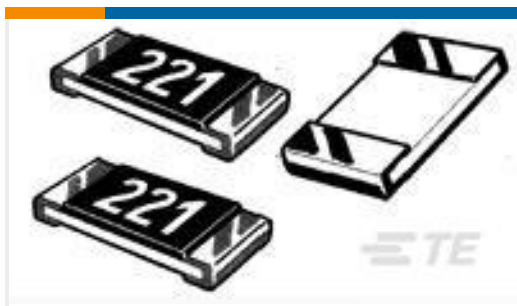
TE 产品编号3-2176231-6 3522 300R 1% 3W