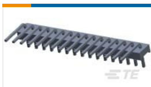
TE 产品编号1-640453-6 16P MTA100 HDR ASSY SQ R/A