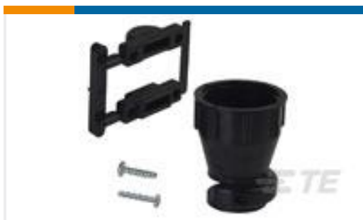
TE 产品编号 206070-8 CABLE CLAMP KIT #17