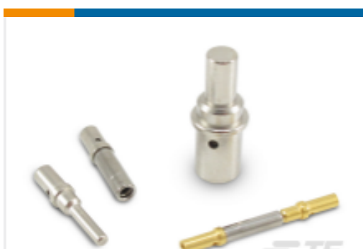
TE 产品编号 0460-202-16141 DEUTSCH Solid Contacts