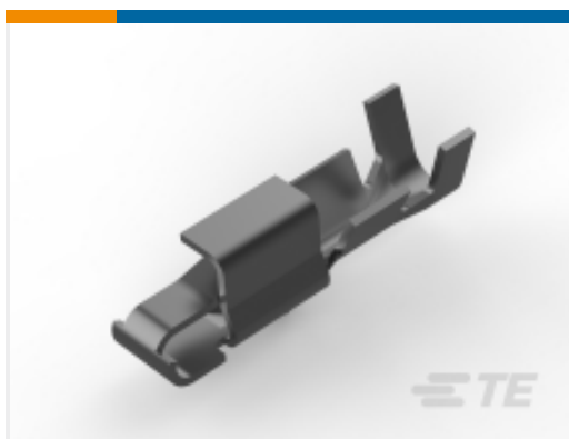
TE 产品编号 CAT-103156-WTBCC Connector Contacts: Wire-to-Board Socket, SL 156