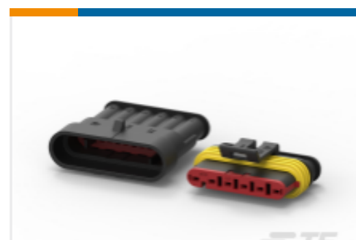
TE 产品编号 282104-1 AMP SUPERSEAL 1.5MM, 连接器壳体