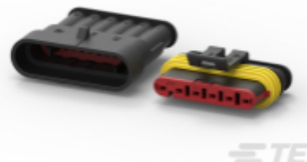
TE 产品编号 282104-1 AMP SUPERSEAL 1.5MM, 连接器壳体