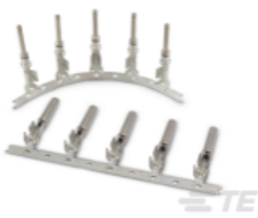
TE 产品编号 CAT-AM7801-T273 AMPSEAL 16 端子