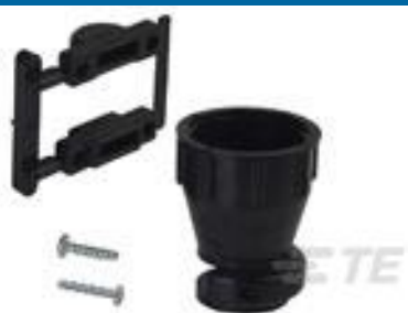
TE 产品编号 206070-8 CABLE CLAMP KIT #17