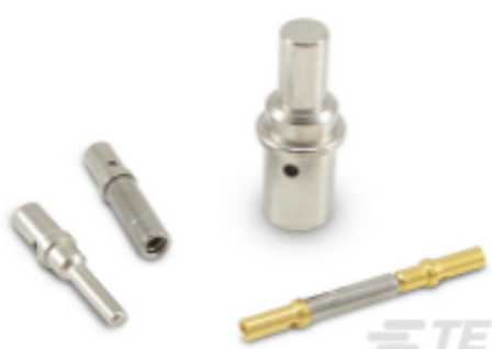
TE 产品编号 0460-202-16141 DEUTSCH Solid Contacts