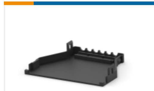
TE 产品编号1776695-1 Strain Relief, D5200, Dynamic