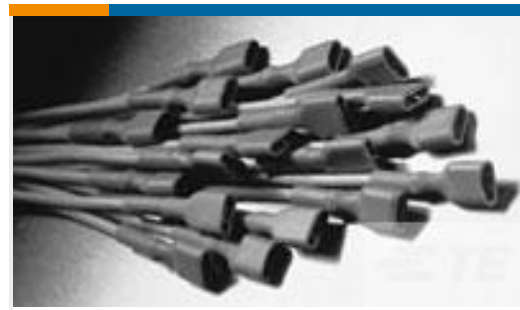
TE 产品编号 6080774003 LSTT-19-4-SP