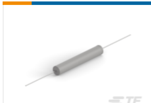
TE 产品编号 8-2176416-5 9W STD M/OX 5% 160K