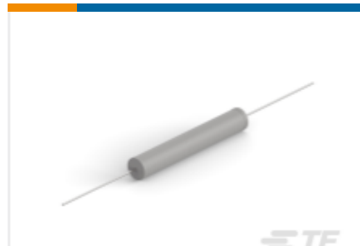
TE 产品编号 1-2176416-5 9W STD M/OX 5% 200R