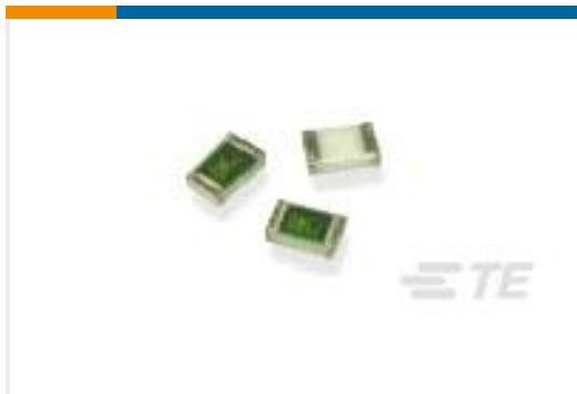
TE 产品编号 7-1879131-0 RN 0402 10K2 0.1% 10PPM CUT LENGTH