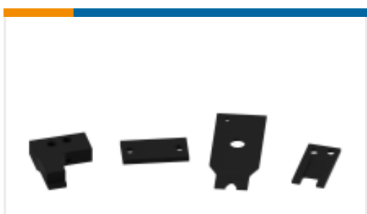
TE 产品编号720491-4 SHEAR PLAT-R