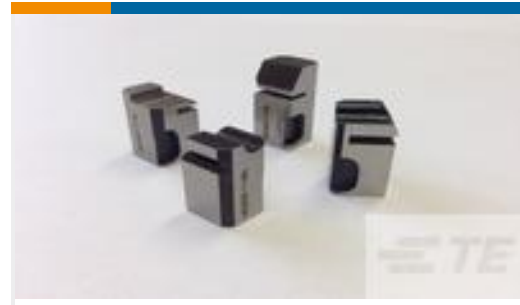
TE 产品编号409284-2 SHEAR FLOAT