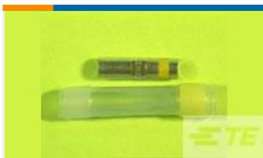
TE 产品编号 650076-000 D-436-38